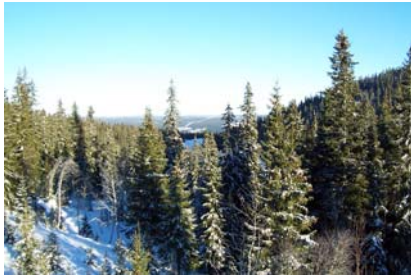
Utsikt mot norr