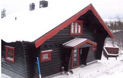
Fasad mot gatan