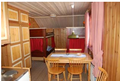
Allrum i en av minisviterna