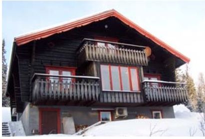
Fasad mot dalen